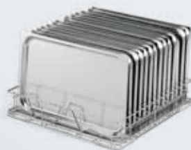
Bandejas 14x1/1 GN