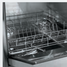
Cesta de acero inoxidable