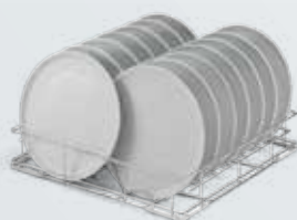
Platos de pizza de 14x320 mm