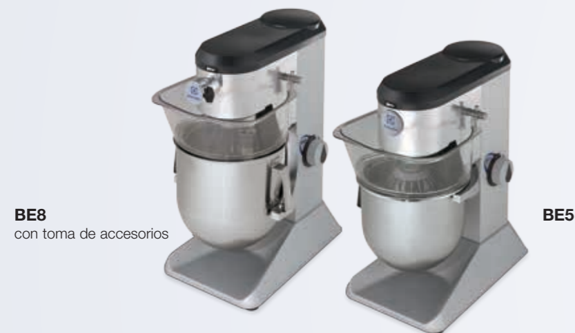
BE8 con toma de accesorios

Maximum performance. Compact yet powerful. Sturdiness above all.