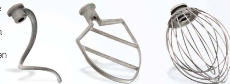
Gancho amasador, paleta y batidor

100% limpieza de las herramientas en lavavajillas (herramientas, cuba y protector antisalpicaduras)