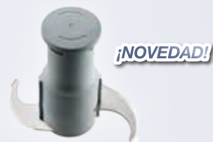
Emulsionador hoja lisa