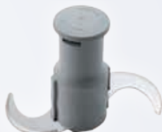
Rotor cuchilla microdentada