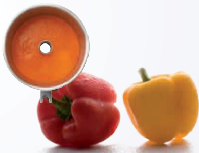
Puré de vegetales