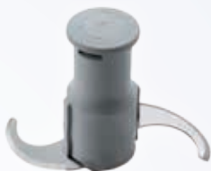
Rotor cuchilla lisa

Elija la cuchilla adecuada para una preparación perfecta.