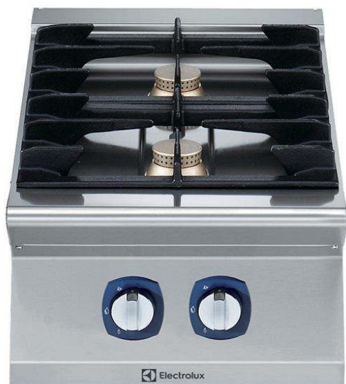
Gamma cottura modulare 700XP Cucina a gas top 2 fuochi

371000 (E7GCGD2C00) Cucina a gas top 2 fuochi (2x5,5 kw)