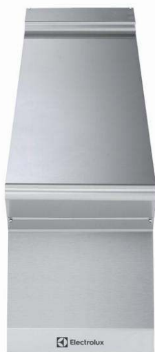
Gamma cottura modulare 700XP Elemento neutro top 1/4 di modulo 371115 (E7WTNBN000) Elemento neutro top con frontale chiuso, 1/4 di modulo