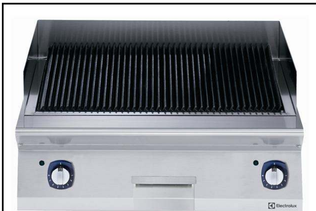
Gamma cottura modulare 700XP Griglia elettrica top modulo intero

371240 (E7GREHGS0U) Griglia elettrica top, modulo intero