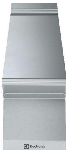
Gamma cottura modulare 900XP Elemento neutro top 1/4 modulo

391156 (E9WTNBN000) Elemento neutro top con frontale chiuso, 1/4 di modulo