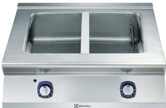
Cottura modulare linea Compact 900XP Bagnomaria elettrico top modulo intero