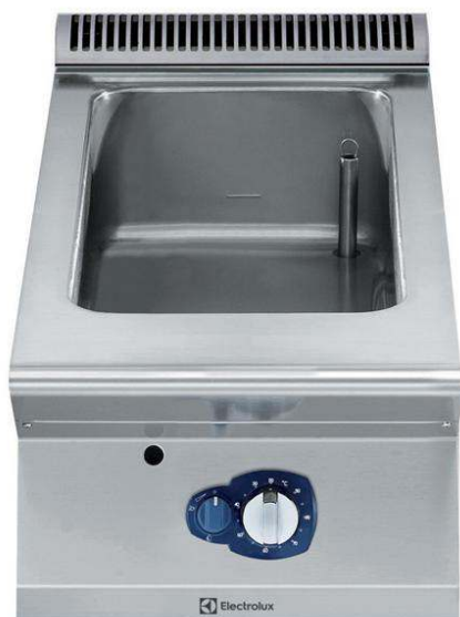
Cottura modulare linea Compact 900XP Bagnomaria a gas top mezzo modulo