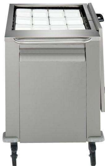
Sistema distribuzione pasti

Carrello sollevatore chiuso per vassoi/ceste - 550x550mm