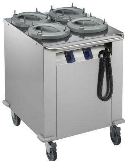
Sistema distribuzione pasti