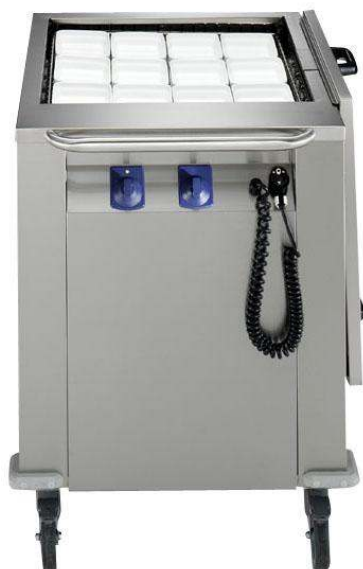
Sistema distribuzione pasti