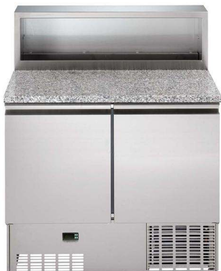
Tavoli refrigerati Saladette - 250 lt, 2 porte