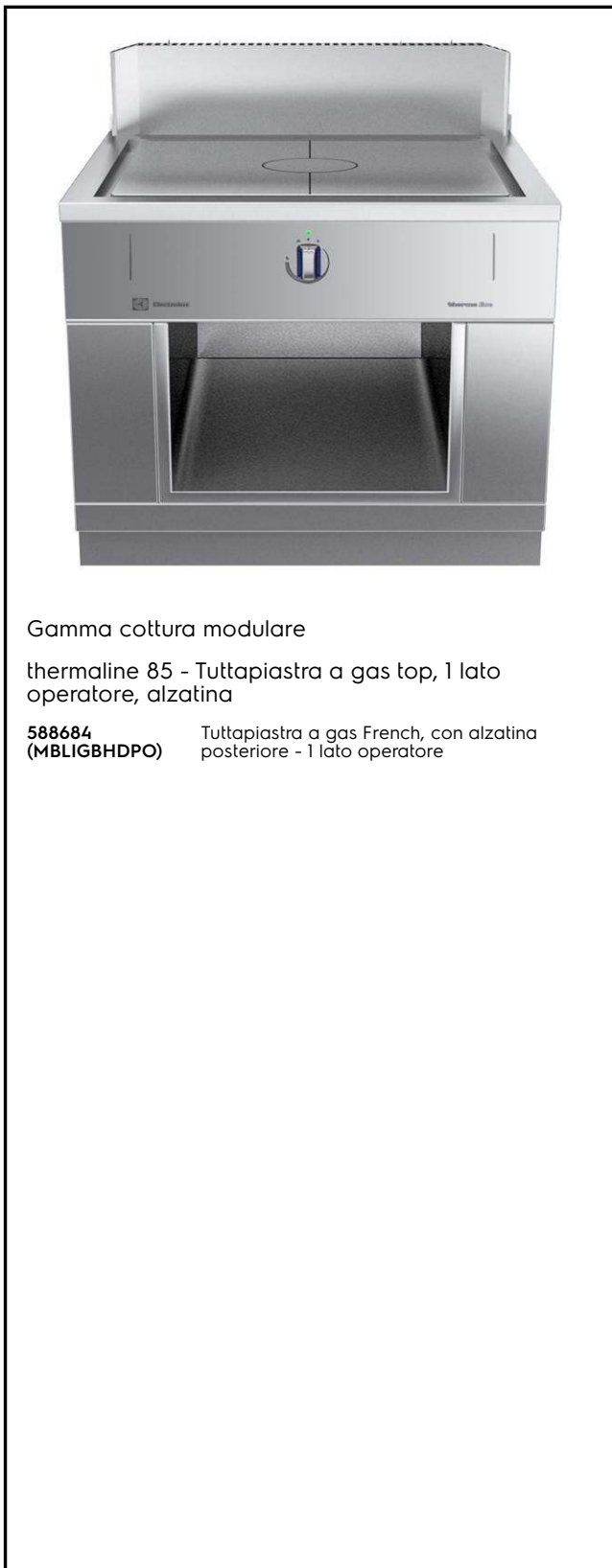
Gamma cottura modulare

thermaline 85 - Tuttapiastra a gas top, 1 lato operatore, alzatina