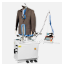
FFT-D Maniquí de americanas