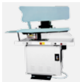
FPA3-D prensa de pantalones