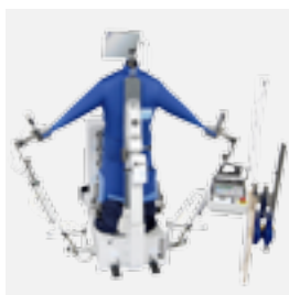
FFT-S Maniquí de americanas