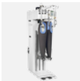
FTT1 topper pantalones