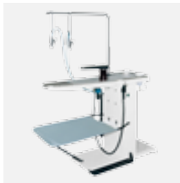
FSU1 mesa desmanchadora

Una amplia gama de opciones y accesorios (carros, bases, unidades de condensación, etc)