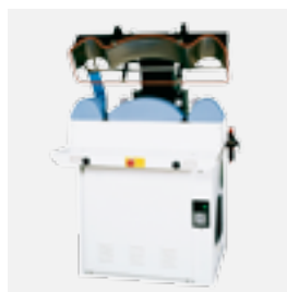
FPA6-WC prensa de cuellos y puños