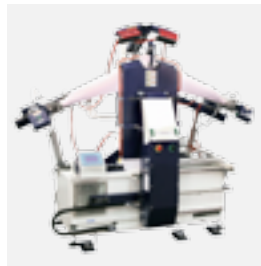
FSF3 Maniquí de camisas