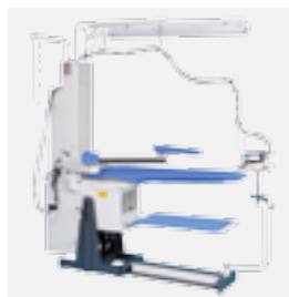
FIT2WC mesa de planchado

Excelencia exclusiva en el Servicio Siempre cerca. Siempre a su disposición.