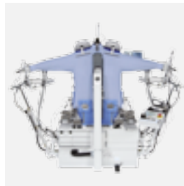
FSF2 Maniquí de camisas